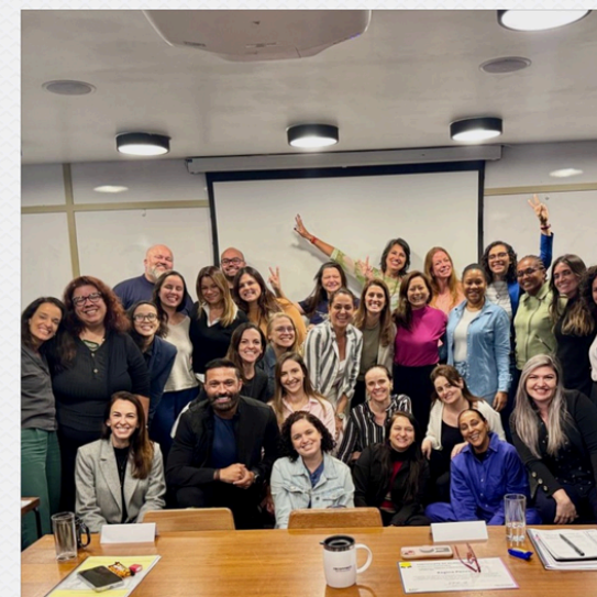
RECONNECT HAPPINESS AT WORK