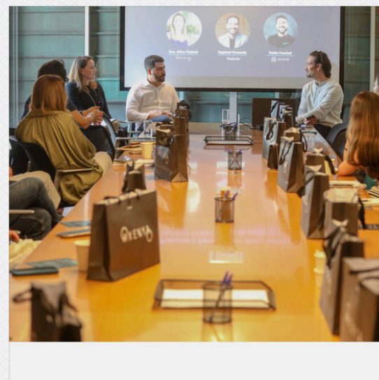
FLUXUS & AXENYA