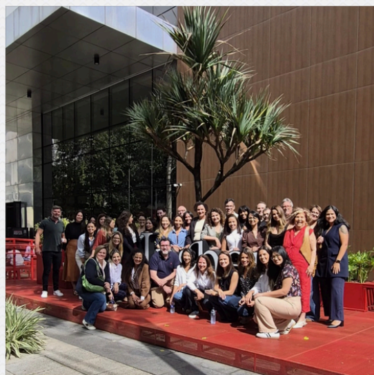
INSPER FORMAÇÃO EXECUTIVA EM NR1

Participação em eventos, formações e espaços de troca que ampliam meu repertório e sustentam a evolução do meu trabalho.